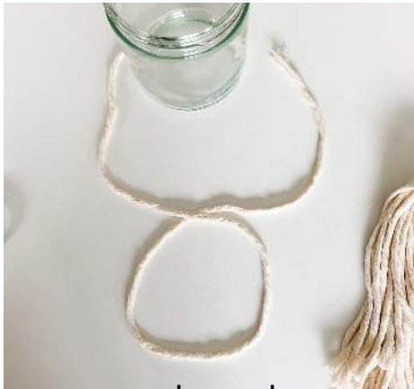
maak een lus

Neem het lange koord. Maak hiermee een lus. Knoop alle andere koorden (BEHALVE het allerlaatste koord) rond dit koord met een opzetknoop.