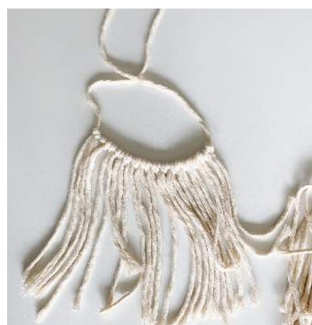
alle koorden behalve 1